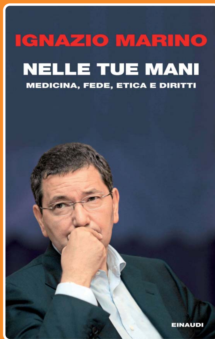
Nelle tue mani di Ignazio Marino (Editore Einaudi)